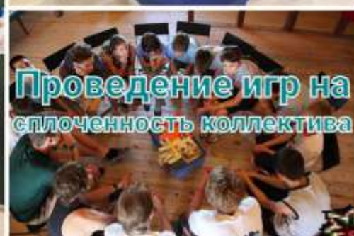
Проведение игр на сплоченность коллектива